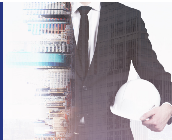
Vielfalt in den Vertriebs-/Produktionskanälen

Mehrdimensionale Vielfalt und Flexibilität zeichnen uns aus.