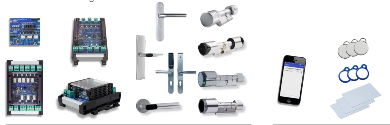
System- und Komponentenausbau so flexibel wie die Kundenwünsche

Von ganz klein bis ganz groß. Flexible Installations- und Bedienmöglichkeiten auf Servern oder in der Cloud: remote auf der ganzen Welt.